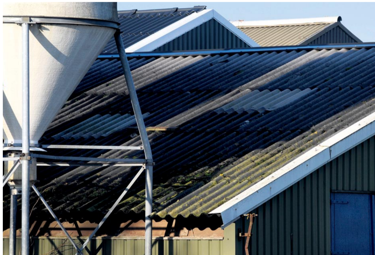
Op 90 tot 95 procent van de stallen en loodsen van voor 1990 ligt asbest.

Groot voordeel voor de boer is ook dat zijn energiekosten de komende 25 tot 30 jaar gelijk blijft